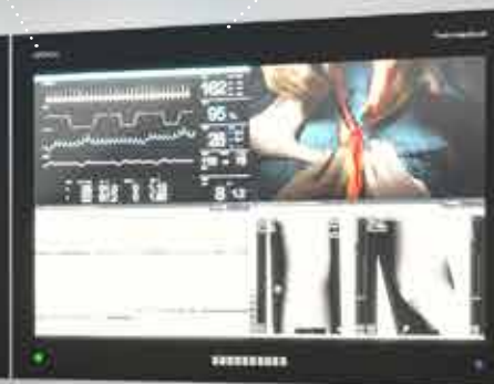
OPERION Large Screen