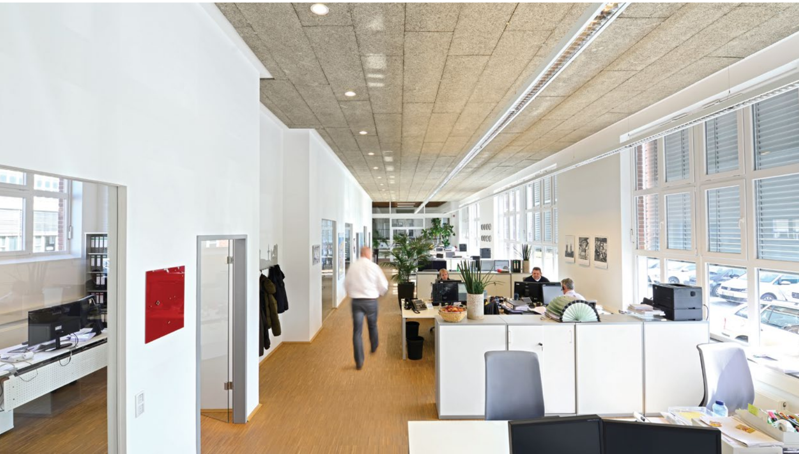
Rein Medical GmbH a Mönchengladbach